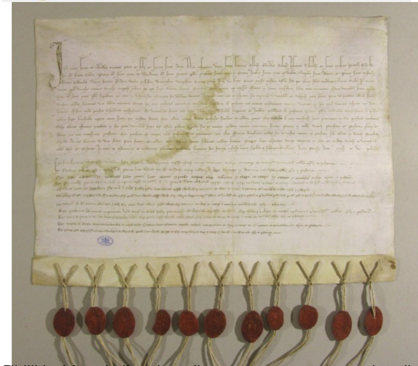
Fig. 1. Questa facsimile, oltre alla pergamena, sono stati realizzati come da originale i cordoncini e i